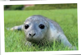
Die Erlebniswelt Wattenmeer