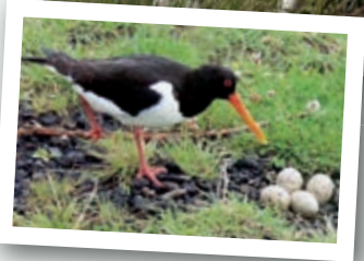
Tierwelt am Deich und in den Salzwiesen